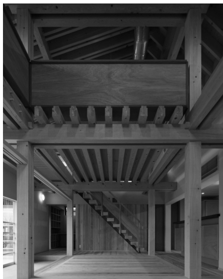
鶴の里の家（竹原義二氏設計）