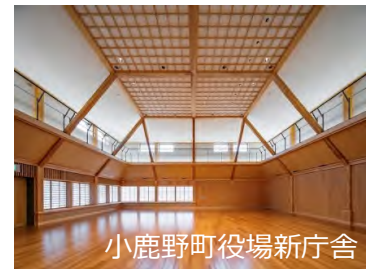
小鹿野町役場新庁舎