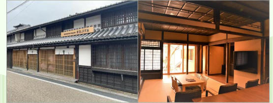
津山市 「城下小宿栞や」