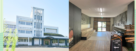
福知山市 THE 610 BASE